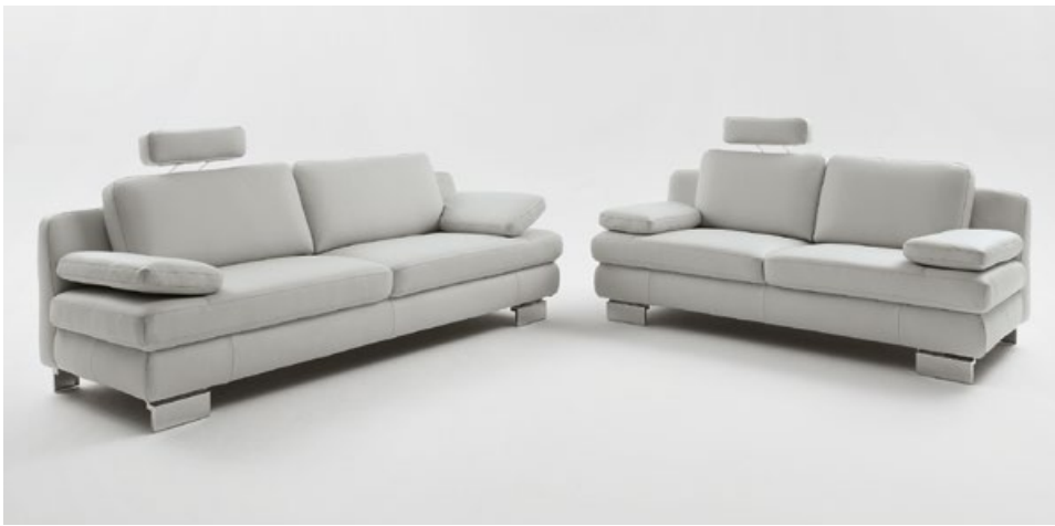
3-Sitzer (3002) und 2-Sitzer (2002) in Echtleder mit variabel einsteckbarer Kopfstütze (9190) und chrombeschichtetem Metallfuß

Eckgarnitur (4402) , bestehend aus einsitzigem Eckelement mit Abschlusselement links, 2-sitzigem Anreihenelement und Longchair mit Armlehne rechts, Schenkelmaß ca. 220 x 333 x 165 cm, in Stoff PG 2 (z. B. Stoff Onyx, 100% Polyester; abgebildet: Stoff Deluxe, PG 3, 100% Polyester):